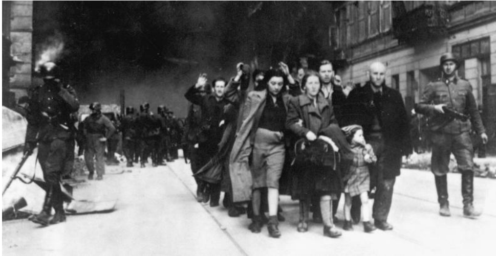
Jødisk ghetto