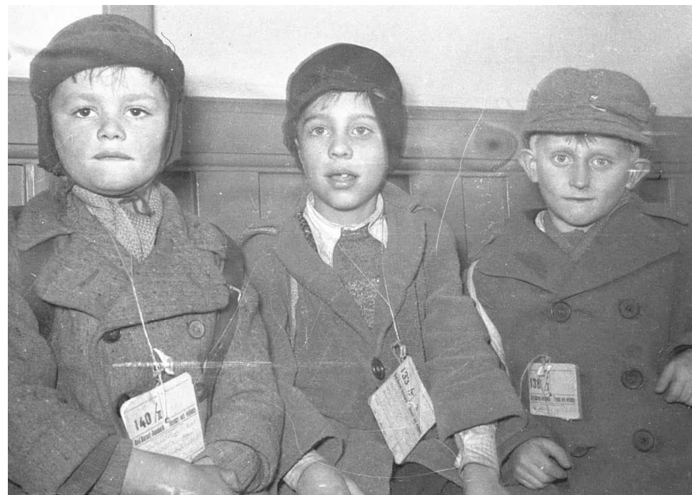
Wienerbørn, 1949.

– artikel i Kristeligt Dagblad (link til artiklen nedenfor)