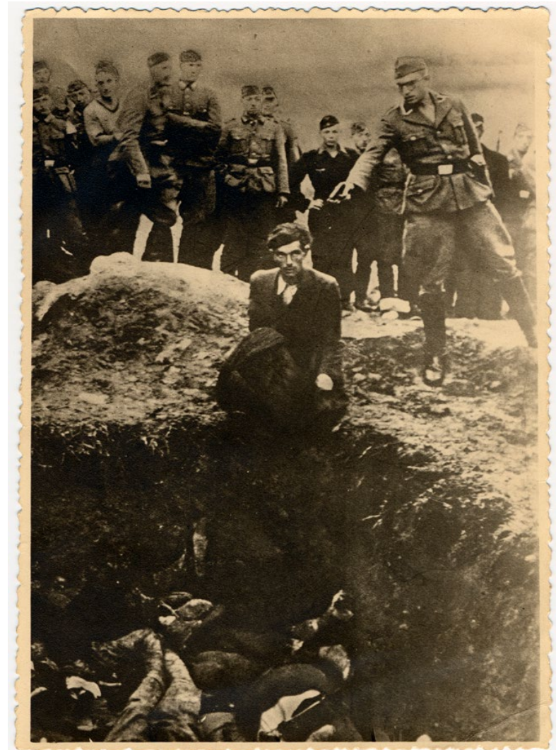
Medlem af nazistisk einsatz-gruppe skyder ukrainsk jøde, Vinnitsa, Sovietunionen, 1942